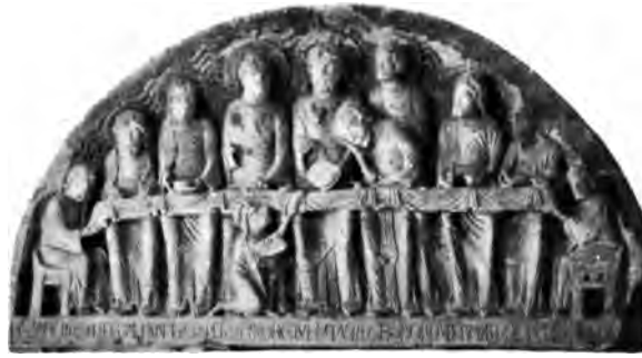
La Cène (Musée archéologique).

et de curiosité. Saint Pierre, qui est à droite du Christ, tourne légèrement la tête vers lui ; de même, les deux apôtres placés immédiatement à gauche, et dont l'un a la main posée sur l'épaule de saint Jean, qui tient lui-même sa tête appuyée sur la poitrine du Sauveur, dans un geste de douleur très bien observé qu'on retrouve sur un chapiteau de Saint-Lazare d'Autun. Sans doute, si l'on applique à l'œuvre ainsi obtenue les règles de la critique, si on étudie la forme en la séparant de l'idée, on constate bien des défaillances et des imitations maladroites ; la régularité des plis des draperies, la symétrie des personnages trop courts,